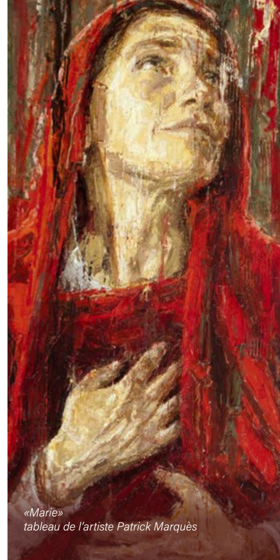
«Marie» tableau de l'artiste Patrick Marquès

D'autres conférences sont proposées, à découvrir sur le site de Saint-Bonaventure : www.saint-bonaventure.fr